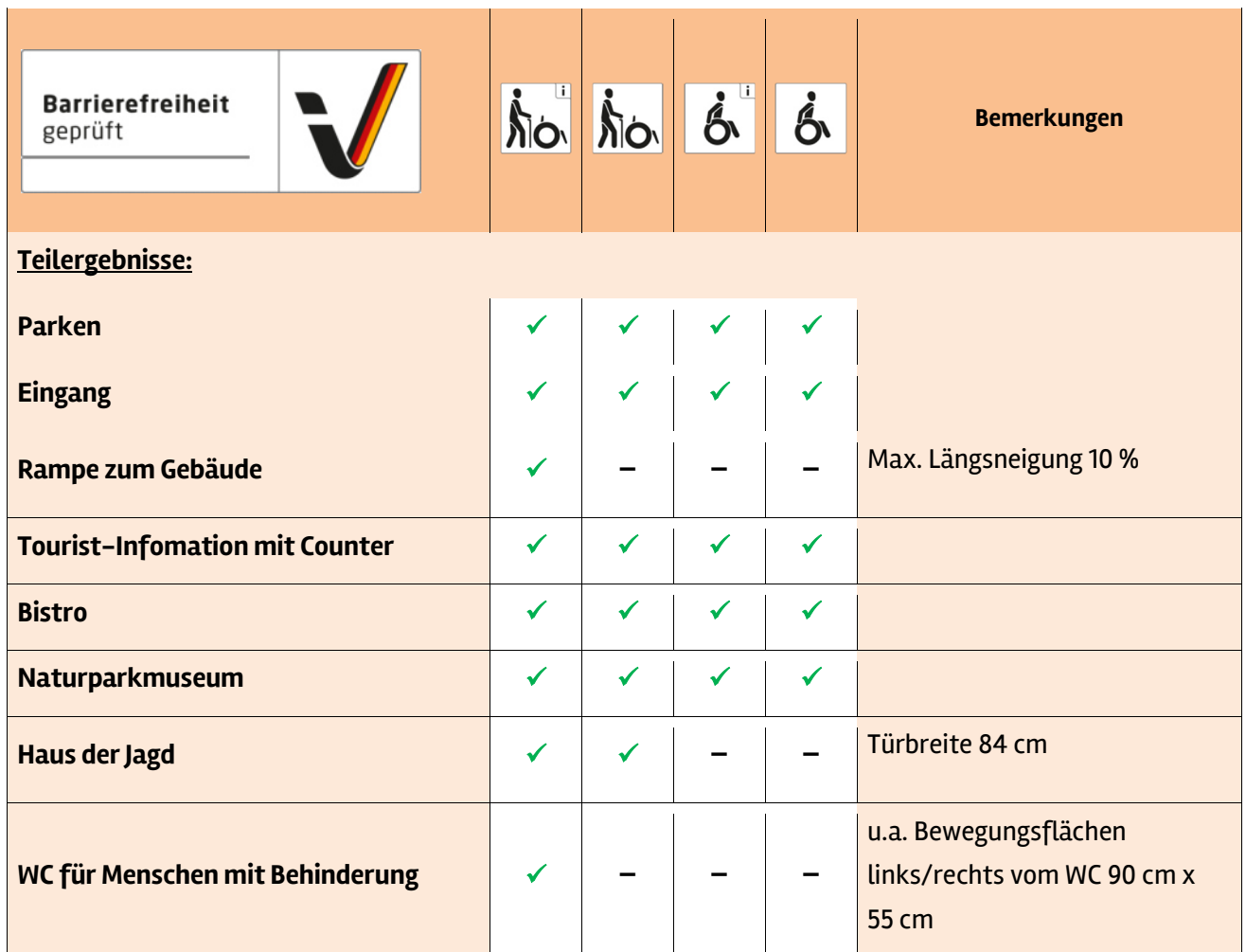
Tabelle 1: Überblick über das Prüfergebnis